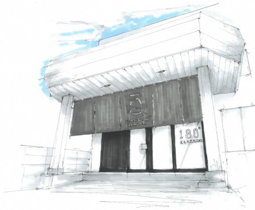
↑シェアハウスのエントランス

↑ネオンで書かれた「Change」は「シェアで人生を180°変えよう」という理念を表現しています。